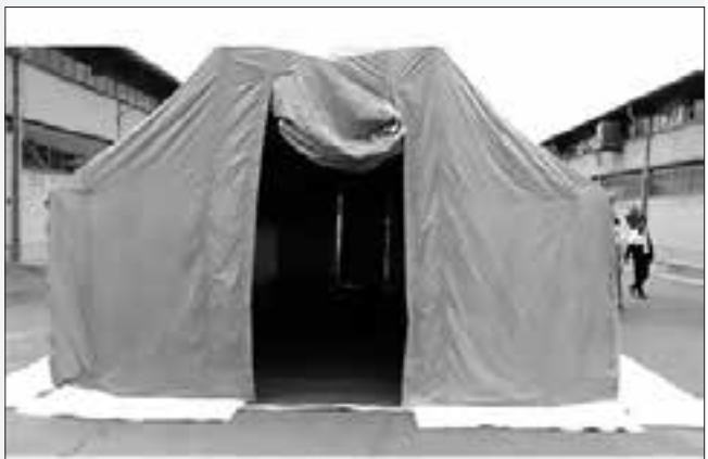
معاون بهداشت، درمان و توانبخشی هلال احمر گفت: چادرهای جدید بهداشت